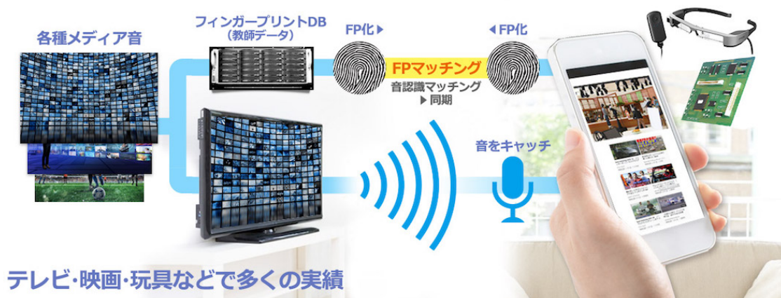
<図1 音声フィンガープリント (FP) 技術の概念>

「音響透かし」とは、音声信号に暗号化を施した文字情報などを埋め込む技術を指し、エヴ