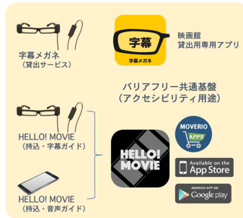
<図4 アプリケーションと貸出サービスの構成>

障害当事者にとっては、健常者とともに流行している映画をタイムリーに鑑賞出来るということが新しいエンターテインメントの体験価値である。また、その価値は障害当事者の家族や友人にも連鎖する。本方式では、障害当事者にも普及しているスマートデバイスを通じて、ガイドの再生機能を提供することで、「公開初日から どの映画館の どの席でも」バリアフリー上映を実現している。なお、スマートフォンに比べて一般に普及していないスマートグラスについては、映画館の窓口で貸出を行う展開を進めている。(2023年2月末現在、全国80以上の映画館で貸出対応)