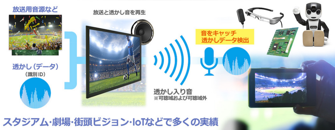
<図2 音響透かし技術の概念>

エヴィクサーは、上記二つの要素技術をビジネス・技術要件に応じて組み合わせることによって、特徴ある通信を実現している。