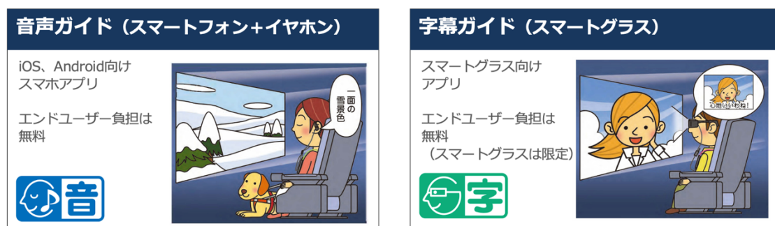
<図3 「HELLO! MOVIE」で提供する音声・字幕ガイドの概要>

本方式では、音声・字幕ガイドはあらかじめ制作され、ユーザーのデバイスにインストールされた専用アプリケーション「HELLO! MOVIE」( https://hellomovie.info/ ) のみを受け皿として、インターネット通信経由でセキュアに配布する。このアプリケーションは iOS、Android、スマートグラス向けに無料で一般公開され、ダウンロードは随時可能であり、映画館に向かう前の動作確認やバリアフリー上映に対応した映画作品を探す機能を有している（2022 年公開の興行収入 10 億円以上の邦画 26 作品中 22 作品に対応）。映画館内でのみ上映される音声を認識するとガイドが再生される仕組みで鑑賞チケットを購入したユーザーの利用に限定される。これは先述の音声フィンガープリント技術による認証機能である。